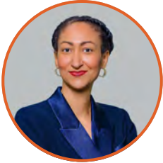
Par Nancy CHENARD, Secrétaire générale exécutive d'UNICONGO